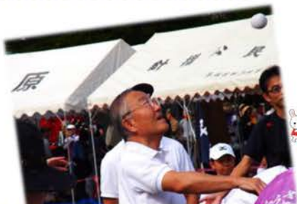
玉入れは、飛んでくる玉がこわかった…!