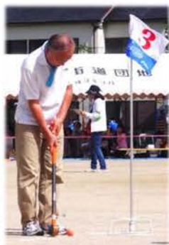
グラウンドゴルフはホールインワンをされた方が！院長先生も健闘されました★