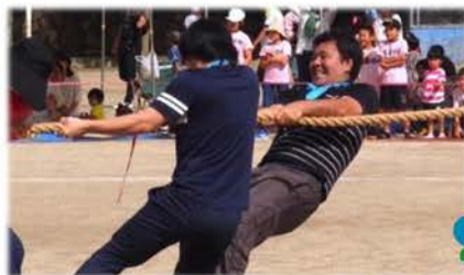
綱引きは残念ながら最後に力尽き…