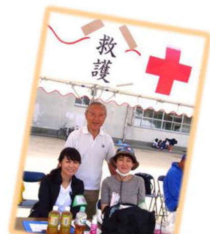
ケガをされた方の応急処置をいたします!

すり傷を負われた方もいらっしゃいましたが、大きなケガもなく皆さん競技に楽しく参加されていました♪