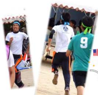
リレーは出遅れましたが、ひとり抜いて大活躍!