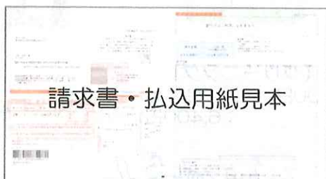
請求書・払込用紙見本